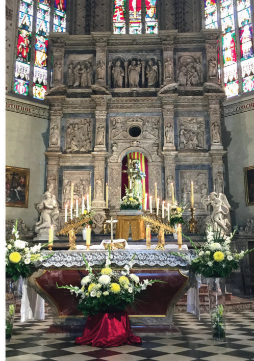
Retable St Jean-Baptiste