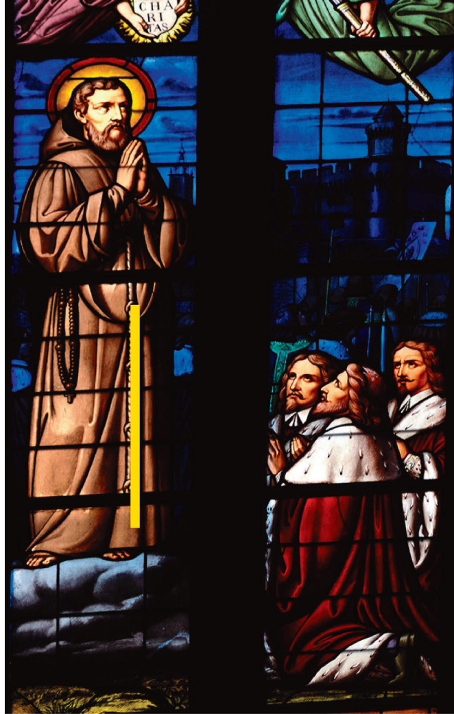
Vitrail Cathédrale. Témoignage d'art, d'Histoire et de Foi.

C'est ainsi que, peu à peu, se renforcent les collaborations, non seulement au sein des communautés de paroisses, mais également