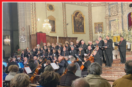
CONCERT POUR NOTRE DAME