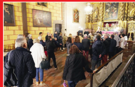
NUIT DES CATHÉDRALES