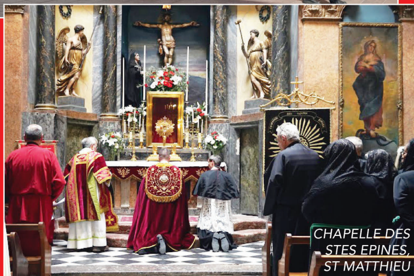
CHAPELLE DES STES EPINES, ST MATTHIEU