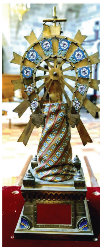
Reliquaire du bras de St Jean-Baptiste, cathédrale

La relique, très vénérée, fut l'objet de diverses anecdotes dont la moins savoureuse n'est pas celle qui concerne la reine Violant, épouse de Jean I : elle demandait une parcelle de la