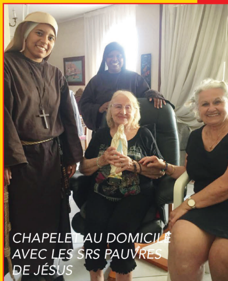
CHAPELLE AU DOMICILE AVEC LES SRS PAUVRES DE JÉSUS

Prochain numéro de Ramellet le 2 juillet 2023