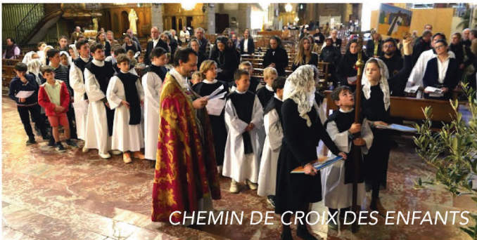
CHEMIN DE CROIX DES ENFANTS