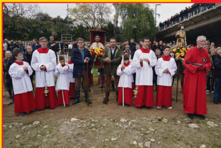
PROCESSION ST GAUDERIQUE

Prochain numéro de Ramellet le 28 mai 2023