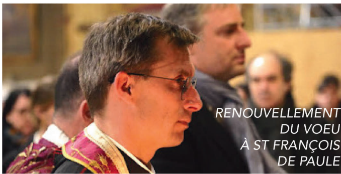
RENOUVELLEMENT DU VOEU À ST FRANÇOIS DE PAULE