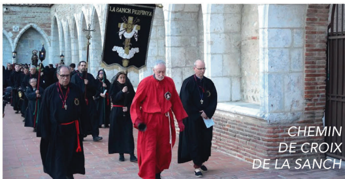
CHEMIN DE CROIX DE LA SANCH