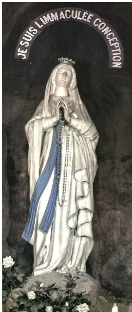
ND de Lourdes Cathédrale.

Il faut dire aussi que dès 1975, a été mis en place dans notre diocèse, un "Rassemble-