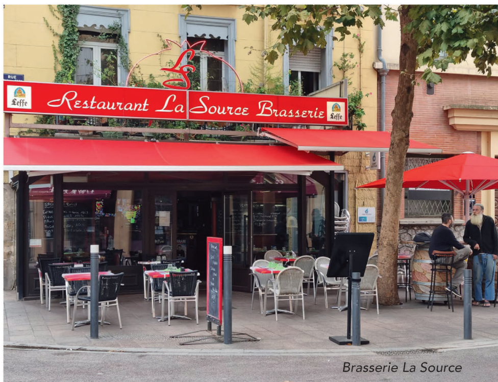
Brasserie La Source