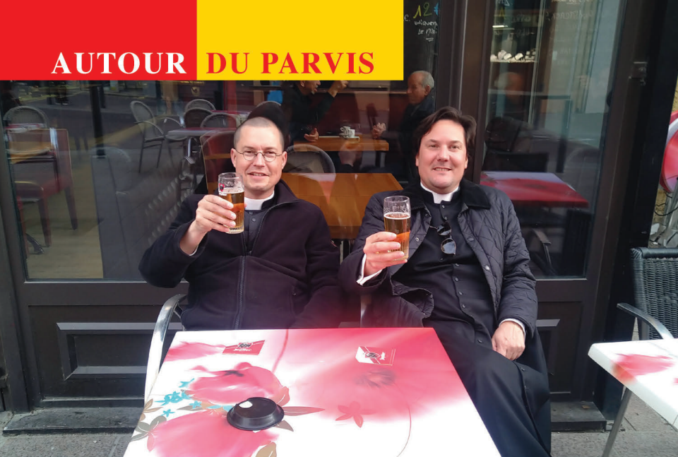
Prêtres... à La Source