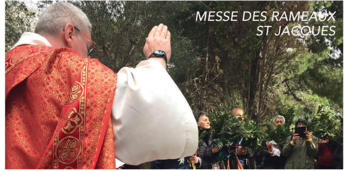
MESE DES RAMEAUX ST JACQUES