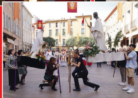
DIMANCHE DE PÂQUES. SALUT DE LA VIERGE À SON FILS RESSUSCITÉ.