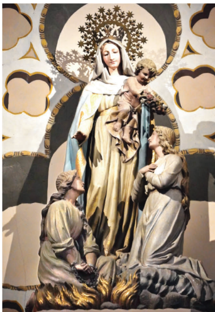
N.D. Libératrice Sanctuaire St Joseph

Le sanctuaire de Montligeon est un lieu de prière pour les défunts situé dans le diocèse de Séez (Orne). On y vient du monde entier confier à Notre-Dame Libératrice les défunts et les âmes du purgatoire. En lien avec cette prière, le sanctuaire développe un ministère de compassion, d'écoute et de consolation auprès de toutes les personnes frappées par le deuil. Pour découvrir leurs propositions : https://montligeon.org/