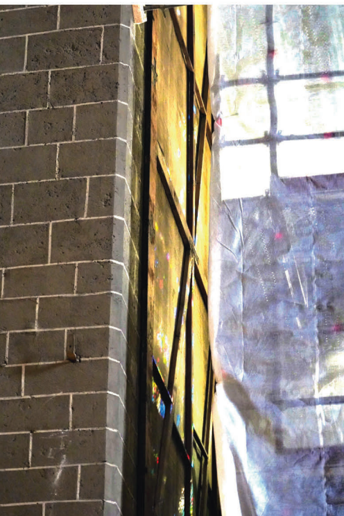
Les cadres vides

La première phase des travaux de dépose des volets d'orgues, du 12 septembre au 5 octobre s'est passée sans encombre, ne nécessitant, comme programmé, la fermeture de la cathédrale qu'une seule journée afin de rentrer en toute sécurité tout le matériel d'échafaudage.