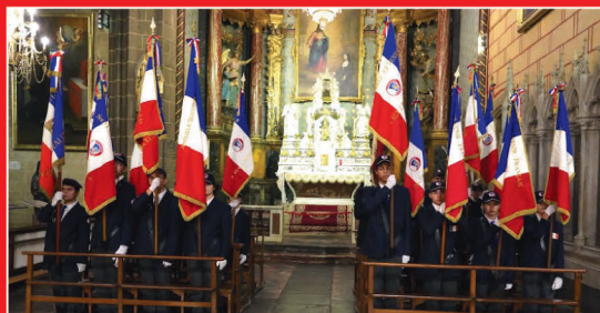
Souvenir Français : Baptême de la promotion des jeunes porte-drapeaux.