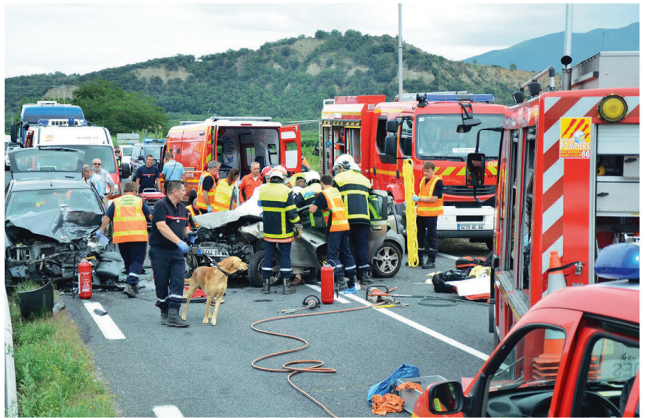
Accident sur la voie publique, avec blessés graves.

Vous retrouvez notre engagement dans l'action du bon samaritain. Nous nous tenons prêts dans la minute, puis nous intervenons, sans perte de temps, sans contrepartie, sans en tirer profit, juste pour vous. Nous ne possédons pas les talents de guérison du Christ. Nous sommes des sauveteurs, pas des sauveurs. Nos efforts peuvent être vains. Mais nous ne les ménageons pas. Le miracle se produit, parfois. Nous vous accompagnons, quand la vie s'en est allée, avec un infini respect. Notre émotion n'est pas feinte, mais discrète ; nul ne ressort indemne de ce combat. Nos jeunes ne s'engagent pas en pensant au pire. Et pourtant, chaque année, c'est un lourd tribut qui est versé pour secourir nos semblables. Chaque départ sur intervention est un saut dans l'inconnu. C'est un flirt avec le handicap, la mort, les vôtres et les nôtres. À nous de faire face, sous la protection de Dieu. Recte faciendo neminem timeas *2! Il faut faire sienne cette devise chrétienne, quand vous partez pour un feu dans un site chimique, dans une centrale nucléaire ou pour des tirs mortels. Qu'importe votre équipement, vous êtes nu, comme l'enfant qui vient de naître ! Aucun maquil-