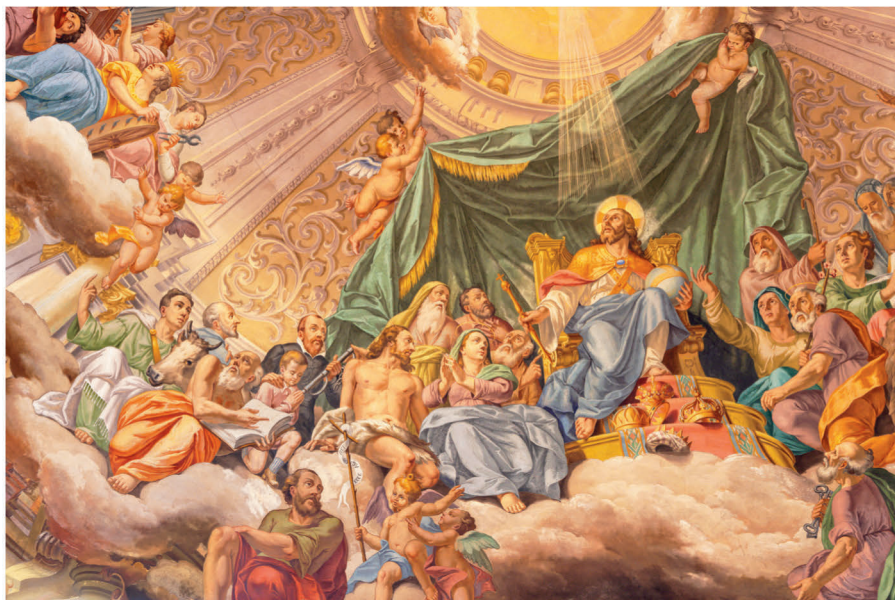
Le Christ Roi. Côme. Italie Sanctuaire du Santissimo Crocifisso

novembre, nous prions d'une manière toute particulière pour les âmes qui sont dans le Purgatoire en attendant la plénitude de la vision béatifique. Combien désirons-nous, du plus profond de notre âme, que ces mots de l'Évangile selon saint Matthieu soient prononcés à notre intention et à l'intention de ceux qui nous sont chers : « Venez, les bénis de mon Père, recevez en héritage le Royaume préparé pour vous depuis la fondation du monde. » (Mt 25, 34)