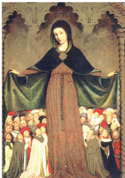
Vierge de Miséricorde par Jean Miraillet, vers 1444. Chapelle de la Miséricorde, de l'Archiconfrérie des Pénitents noirs de Nice. Aujourd'hui musée Massena Nice.

La Vierge choisie par l'Œuvre Notre Dame du Suffrage, Vierge de Miséricorde, selon l'iconographie traditionnelle, est en position déhanchée, ou contrapposto en italien. Elle est représentée, symboliquement, plus grande que les autres personnages ; debout, de son manteau ouvert elle protège de nombreux priants : rois, évêques, les commanditaires, des religieux, des laïcs, tout un peuple de croyants.