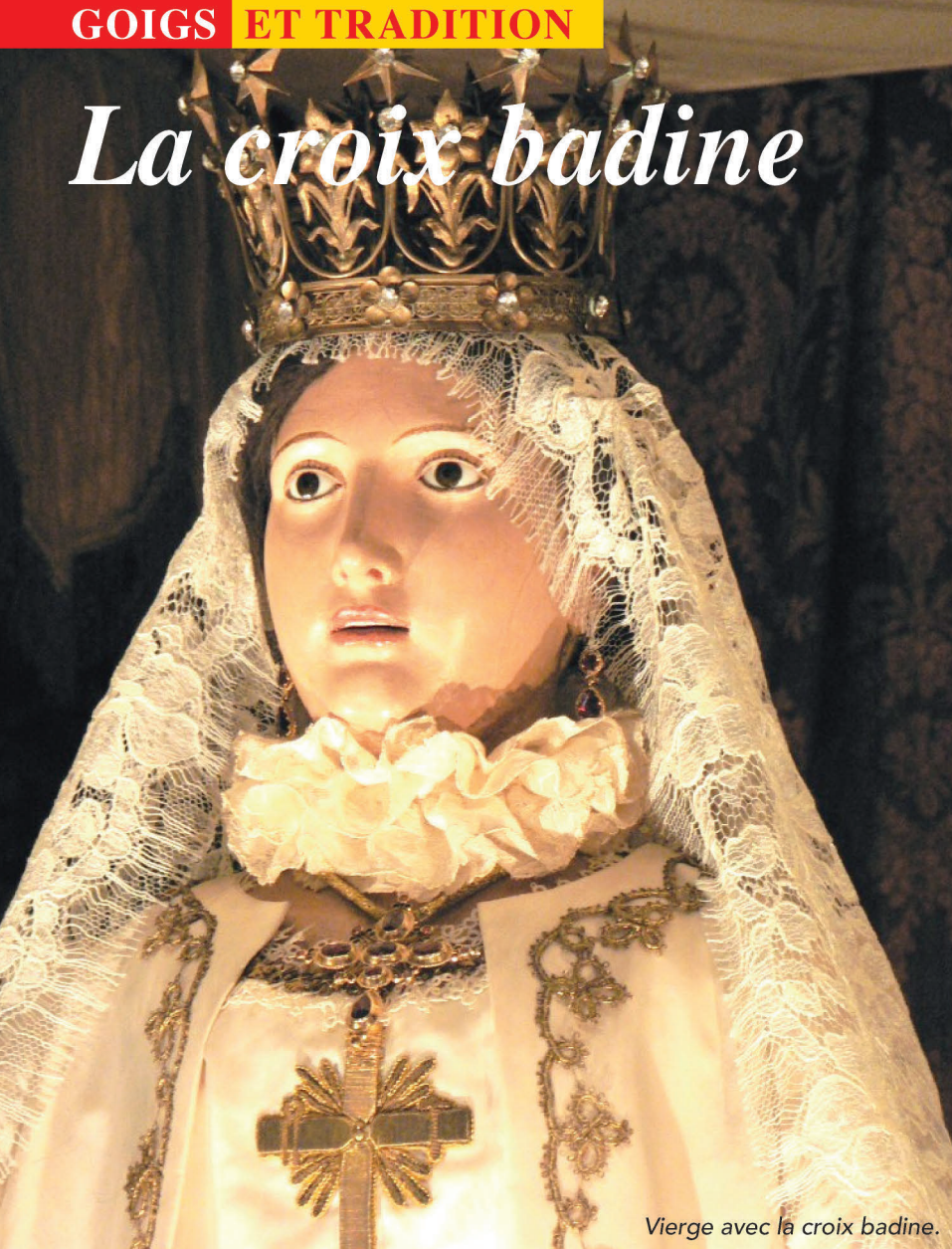
Vierge avec la croix badine.

La croix badine est la croix la plus typique des croix fabriquées en Roussillon. Elle est réalisée traditionnellement en or avec des grenats. Le terme de badine désignait un objet mu d'un léger tremblement, que ce soit le vent sur une dentelle badine ou bien l'effet de la charnière qui donne à la croix catalane un petit mouvement. Ce genre de bijou est réalisé en serti clos dressé avec bélière retournée et invisible. La partie mobile est reliée