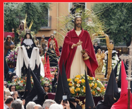
Vendredi Saint : Procession de la Sanch