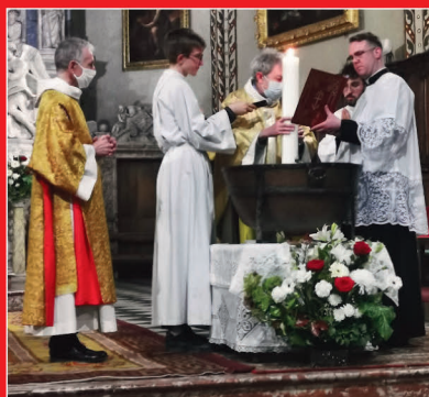
Vigile de Pâques et baptêmes d'adultes