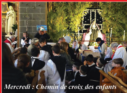
Mercredi : Chemin de croix des enfants