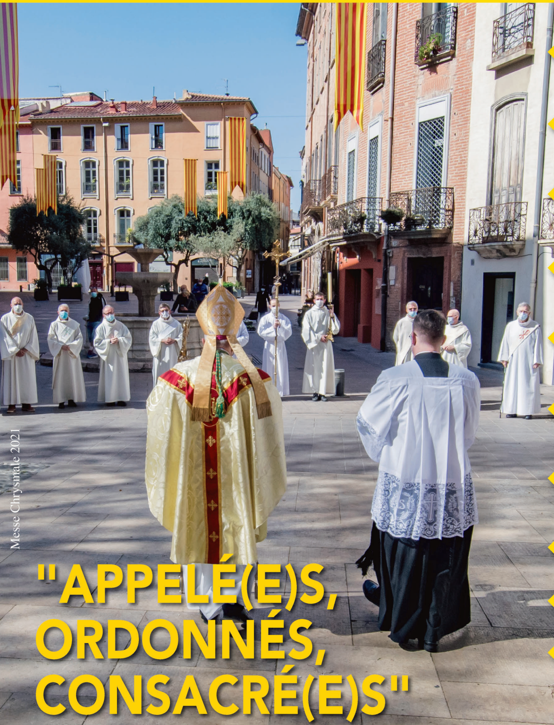
Messe Chrysmale 2021

CENTRE VILLE DE PERPIGNAN BULLETIN PAROISSIAL • MAI 2022 • n°129