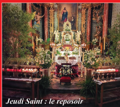
Jeudi Saint : le reposoir