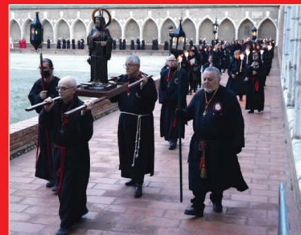
Mercredi : Renouvellement des vœux de la ville à St François de Paule