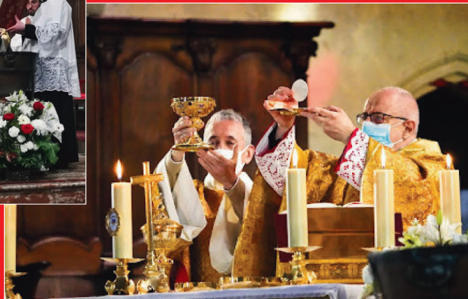
Dimanche de Pâques