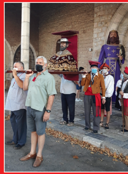
Buste reliquaire de saint Jacques