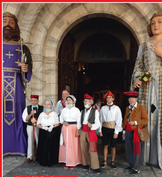
Fête à l'Eglise St Jacques