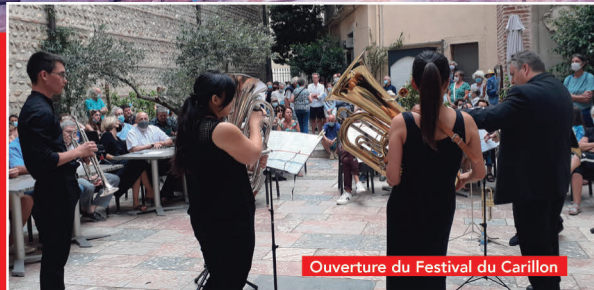
Ouverture du Festival du Carillon