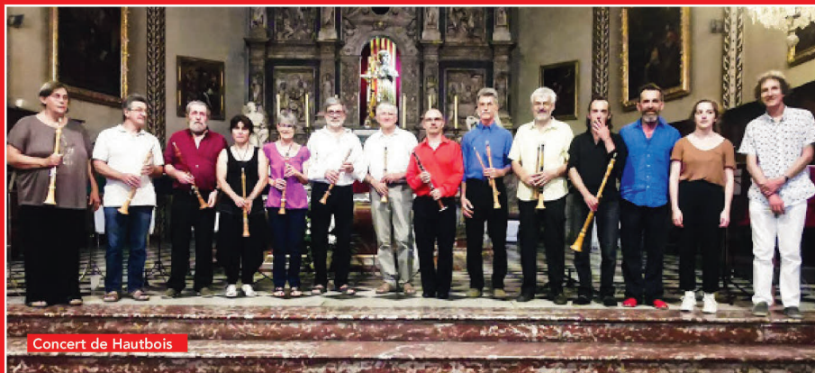
Concert de Hautbois